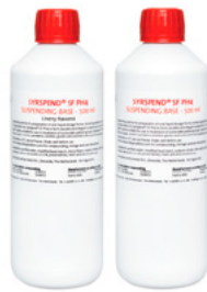
SyrSpend® SF PH4 (liquid) (TARTÓSÍTOTT)