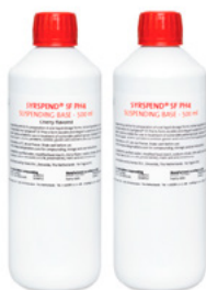
SyrSpend® SF PH4 (liquid) (TARTÓSÍTOTT)