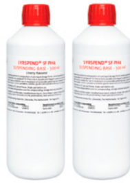
SyrSpend® SF PH4 (liquid) (TARTÓSÍTOTT)